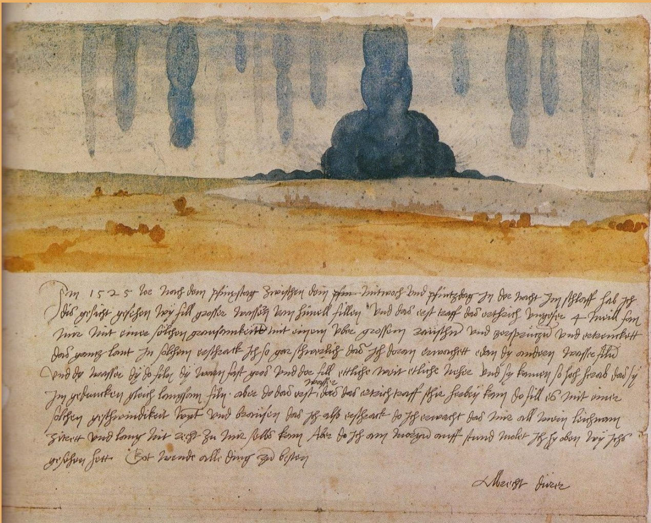
Albrecht Dürer : vision de rêve, 7-8 juin 1525. Aquarelle sur papier, 30x43 cm, Vienne, Kunsthistorisches Museum

Maison de la Recherche - Salle des colloques - ARRAS